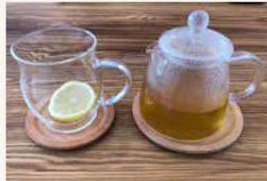
▲ハーブティー First quarter 免疫力・落ち着き・健康・栄養(ハワイ産ノニリーフ・マテ茶・ターメリック・レモンピール・レモン)