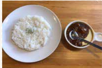
▲シーフードチーズカレー

札幌市北区北18条西4丁目2-30 坪川ビル坪川マンション1階 011-374-6787 月/11:30~15:00(L.O.) 火~金/11:30~15:00(L.O.) 17:30~22:30(L.O.) 土・日/11:30~22:00(L.O.) 不定休