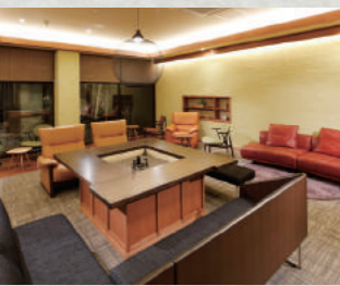
様々なソファが置かれた囲炉裏を囲むラウンジは、宿泊客の憩いの場

湯の川温泉を源泉100%掛け流しで楽しめる、26室の小さなお宿。函館近海の旬の魚介にこだわった食事が評判で、3月の夕食は寿司メインのコース料理がマグロづくし! 朝イカやマグロの中落ち、ステーキなどが並ぶ朝食バイキングも大満足です。ラウンジに無料のスパークリングワインやソフトクリーム、客室にもコーヒー豆とミルが用意されるなど、館内でくつろげる気遣いが随所に。自分の別荘のようにゆったり過ごせます。