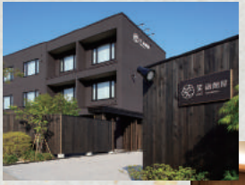
2016年4月にオープンした、アットホームな雰囲気温泉宿