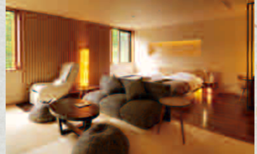
66~78㎡とゆったりした温泉露天風呂付きスイート。和風リビングとツインルーム、展望露天風呂でくつろげます