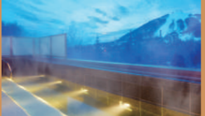
羊蹄山麓の天然水を利用した大浴場を完備。柔らかな肌触りの湯に包まれ、露天風呂や内湯でリフレッシュできます。