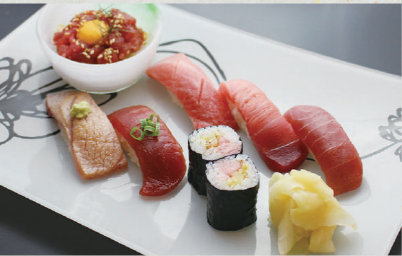
マグロを主役とした全8品の「笑コース」は3月末まで。大トロ、中トロ、炙り、漬けなど寿司の食べ比べも楽しい

湯の川温泉を源泉100%掛け流しで楽しめる、26室の小さなお宿。函館近海の旬の魚介にこだわった食事が評判で、3月の夕食は寿司メインのコース料理がマグロづくし! 朝イカやマグロの中落ち、ステーキなどが並ぶ朝食バイキングも大満足です。ラウンジに無料のスパークリングワインやソフトクリーム、客室にもコーヒー豆とミルが用意されるなど、館内でくつろげる気遣いが随所に。自分の別荘のようにゆったり過ごせます。