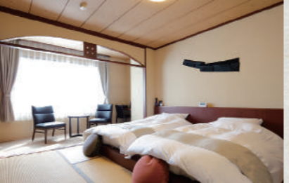
我が家のように居心地の良い客室。全室にコーヒー豆とミルクがあり、挽きたてコーヒーが気軽に楽しめます