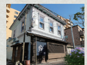
姉妹ホテルの「函館クラシックホテル」もおすすめ。古民家を再生した一棟貸しの宿です(函館市弁天町16-9)