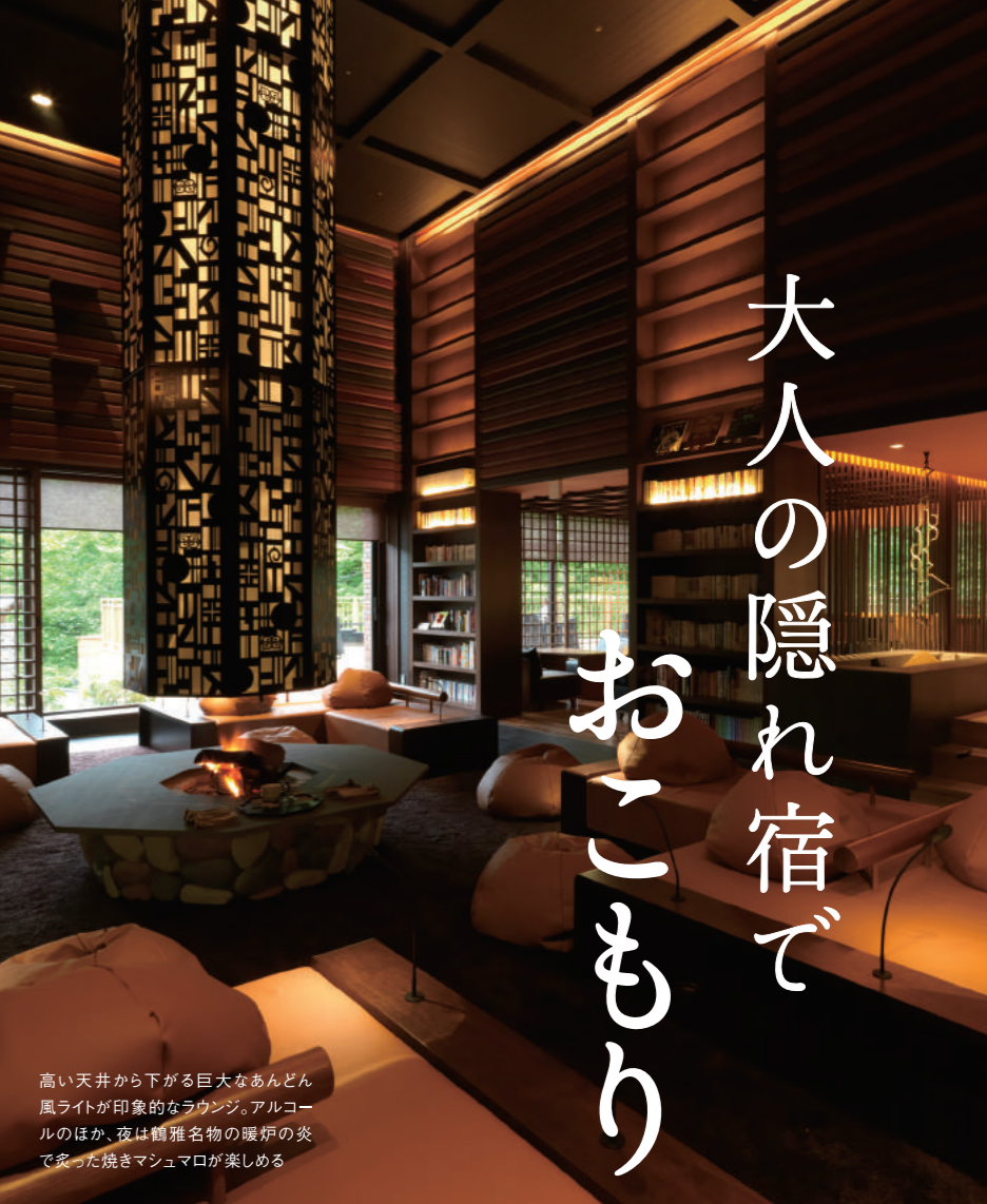
高い天井から下がる巨大なあんどん風ライトが印象的なラウンジ。アルコールのほか、夜は種々な物の暖炉の炎であった焼きマッシュマロが楽しめる