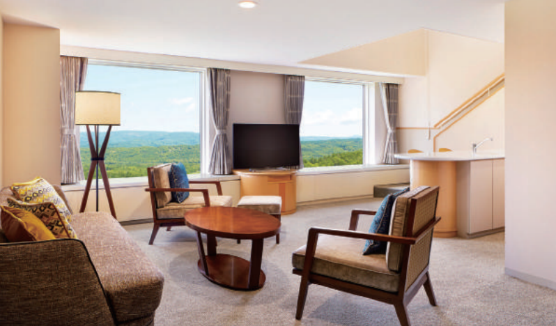
リビングも寝室も窓からの眺めは最高。全客室でWi-Fiが利用できるので、パソコン持参でのおこもりもオススメです