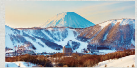
羊蹄山が見守る雄大な高原に位置するリゾート

世界的ホテルブランド「ウェスティン」ならではの最高品質な空間で、のんびり過ごしませんか。一番の魅力は、全室がベッドルームとリビングルームの2階層からなるメソネットタイプの客室。76㎡以上の広さに加え、大きな窓から望む雄大な景色、雲の上の寝心地を追求したヘブンリーベッドなど、こだわり満載です。ディナーbuffetが楽しめる「アトリウム」はグリーンカレーなどのランチも人気。一部メニューはルームサービスでも楽しめます。