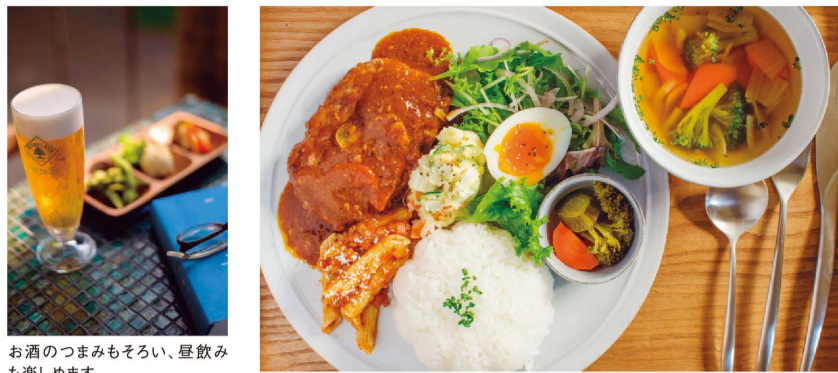
お酒のつまみもそろい、昼飲みも楽しめます