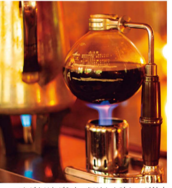
コクがありながらすっきりとした味わいが魅力

札幌市南区藻岩下2-4-11 ☎011-583-9349 11:00~23:00(金・土曜、祝日は~24:00) 無休