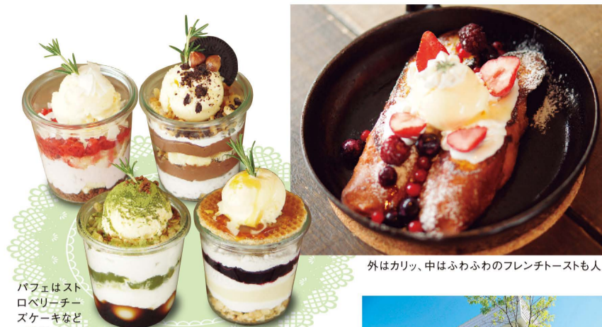
パフェはストロベリー、チョコレート、スコーンなど4種類