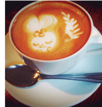
味わうのがもったいない! キュートなラテアート

札幌市北区屯田5-5-7-3 ☎011-774-6804 11:00~16:00 土・日・月曜休