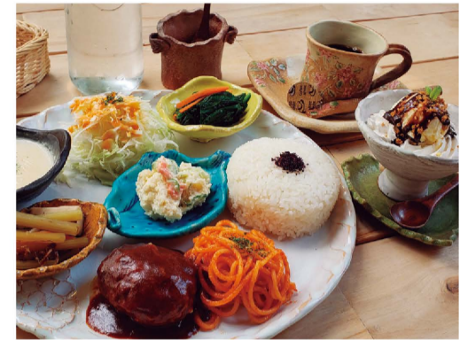
「おとな様プレート」はドリンク、デザート付きで1500円

札幌市中央区南6西18-2-11 ☎011-512-8802 11:00~17:00(土・日曜、祝日は~20:00) ※1~3月は全日~17:00 木曜