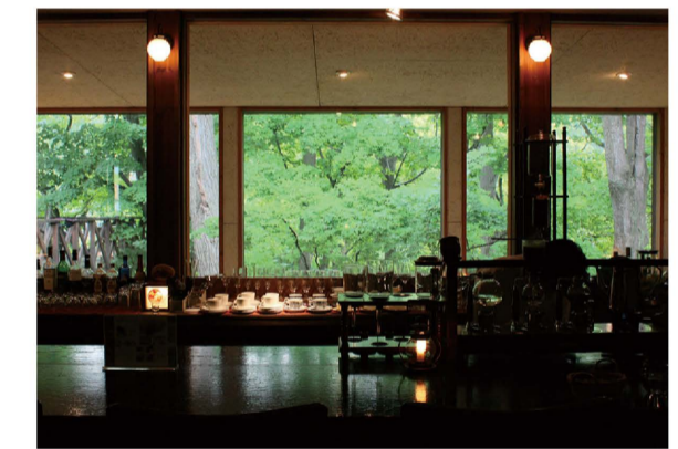
森を眺めながら、ゆったりとした時間が楽しめます