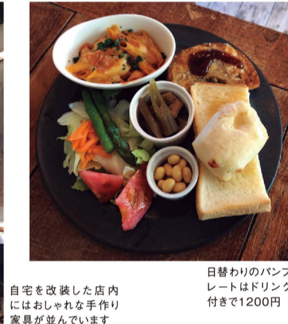
日替わりのパンプレートはドリンク付きで1200円 自宅を改装した店内にはおしゃれな手作り家具が並んでいます