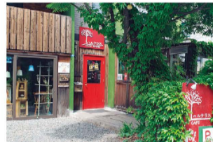
赤い看板が目印。カフェの横には木々に囲まれたテラス席もあります