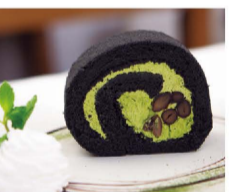
一番人気のスイーツは「竹炭抹茶ロール」