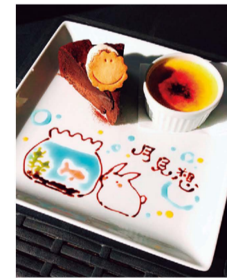
ガトーショコラ&クリームブリュレ650円