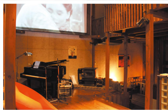
プロジェクターやグランドピアノも完備

春から秋までは、テラスでの記念撮影も可能です。 令和元年12月まで挙式の方は写真撮影サービスの特典あり。