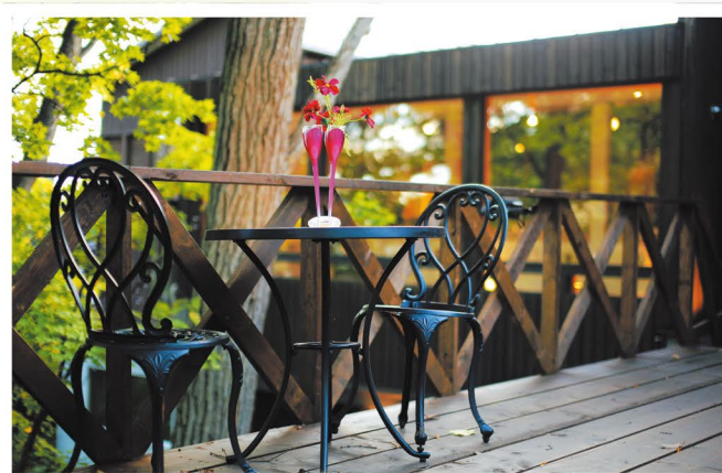
テラスで思い出に残る1枚を

春から秋までは、テラスでの記念撮影も可能です。 令和元年12月まで挙式の方は写真撮影サービスの特典あり。