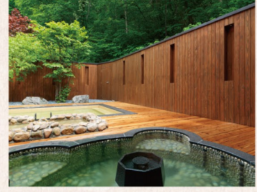
昆布温泉特有の塩化物泉はなめらかな肌触りで、湯上り後はしっとり

暮れゆく秋のニセコへ、ちよっと大人な小旅行に出かけませんか。冬は大勢のスキーヤーで賑わう町も今は落ち着いた雰囲気。紅葉や温泉がのんびり楽しめる。お得に泊まれる穴場のシングルルームもあります。そんなニセコでワンランク上の滞在を叶えてくれるのがニセコ昆布温泉 鶴雅別荘 空の抄。古くから湯治場として親しまれてきた奥ニセコ昆布温泉にあり、自然豊かなロケーションと全25室のほど良いプライベート感が魅力です。