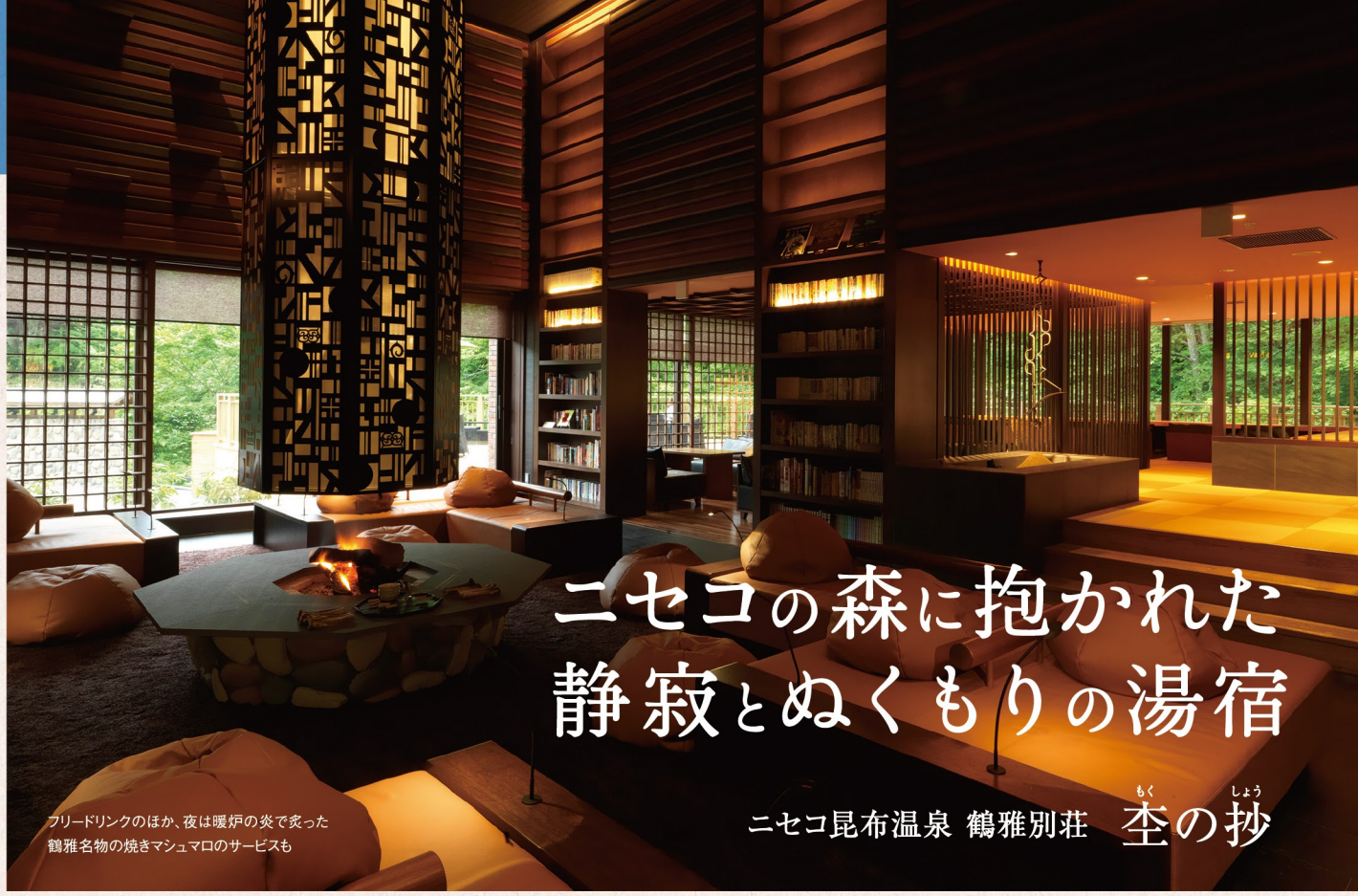
フリードリンクのほか、夜は暖炉の炎で焚いた雑穀名物の焼きマッシュルームのサービスも