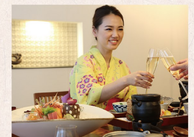
女性には数種類から選べる色浴衣を用意。足湯や夕食などつろぎのひと時を好みの浴衣で過ごして