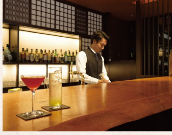
バーの飲み物も無料。グラス片手に秋の夜を楽しんで