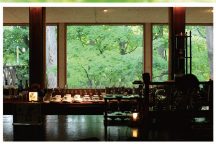
藻岩山麓の木々に包まれたカフェ 新緑や紅葉の季節は圧巻のロケーションです。 木のぬくもりを感じる店内の優しい雰囲気が自慢です。