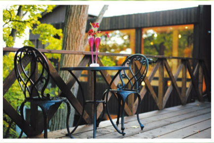
テラスで思い出に残る1枚を 春から秋までは、テラスでの記念撮影も可能です。 令和元年12月まで挙式の方は写真撮影サービスの特典あり。