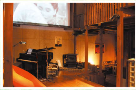
プロジェクターやグランドピアノも完備 プロジェクターやピアノ、音響設備もございます。 専属のウェディングプランナーもおりますので お気軽にご相談ください。