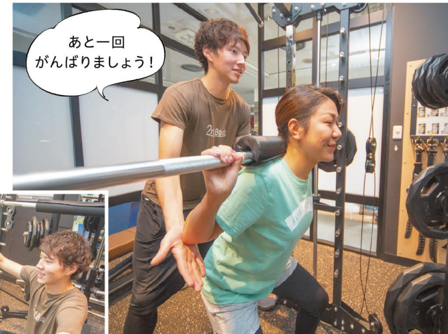
あと一回がんばりましょう!

まずはヒップラインを引き締めるスクワット。個々に合わせたレベルの重りをつけてスタート。お尻の筋肉に…キター! 正しい姿勢を教えるので腰や背中に無理なくできる!