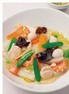
レストランの一番人気は海鮮あかけ焼きそば(780円)。豊富な品揃えと味の良さでも評判!

恵庭市恵南4-1 ☎0123-32-4171 11:00~23:00 休なし 大人440円、小学生140円、幼児無料