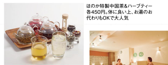
ほのか特製中国茶&ハーブティー各450円。体に良い上、お湯のお代わりにOKで大人気