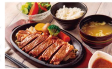
「スパ&お食事セット」は通常4,400円相当なので、かなりお得! ガランのままです