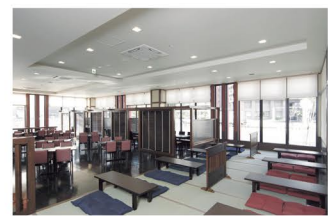
定食や一品料理などメニュー豊富な食事処。豊の小上がりは家族連れに人気

札幌市中央区北2東13-25-1 ☎011-200-3800 10:00~24:00(23:00受付終了) 休なし 12歳以上450円、6~11歳140円、5歳以下70円