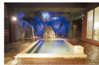
夕方から青くライトアップされ、幻想的な雰囲気が楽しめる洞窟風呂