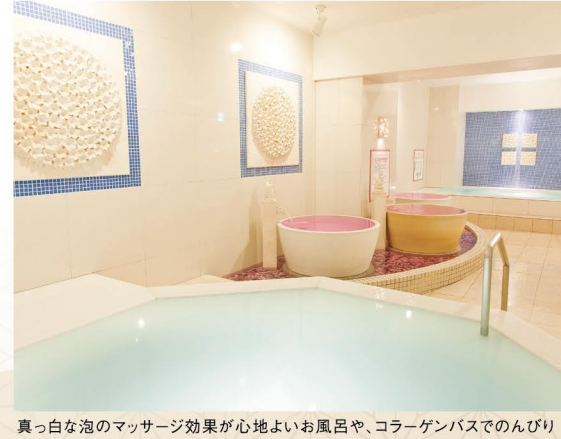
ヒスイやメノウなど、効果の異なる様々な石を使った岩盤浴。韓国式伝統サウナ「薬香汗蒸幕」もある