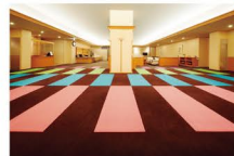
男女問わず、初心者でも参加できるemisia YOGA。レッスンはスパでくつろいで

札幌市厚別区厚別中央2-5-5-25 ☎011-895-8822 スパ11:00~24:00(最終受付23:00) スパラウンジ11:00~23:30(LOフード22:00、ドリンク23:00) 休なし 大人2,600円、3歳~小学生1,700円 ※宿泊者は料金異なります