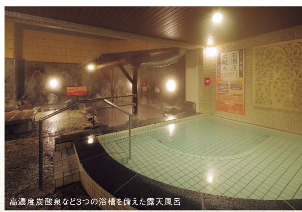
高濃度炭酸泉など3つの浴槽を備えた露天風呂

平日: 大人(中学生以上)950円、 シルバー(65歳以上)850円、 子供(3歳~小学生)350円 土日祝: 大人(中学生以上)1,050円、 子供(3歳~小学生)400円、 幼児(3歳未満)全日無料 (大人は湯量/バス・フェイスタオル付き子供は館内着付き) ※深夜1時以降は深夜割増料金を加算