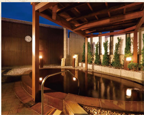
茶褐色の天然モール泉は、湯上りの肌がしっとりすべすべに

公衆浴場ながら、希少な天然モール泉を100%源泉掛け流して楽しめる札幌市内唯一の浴場。内風呂のほか露天風呂やサウナがあり、シャンプーやボディソープも備え付け。利用1回で1個捺印のスタンプカードは、スタンプ10個で次回入浴無料とさらにお得です。プライベートな空間でのんびり入浴できる家族風呂もお試しを。