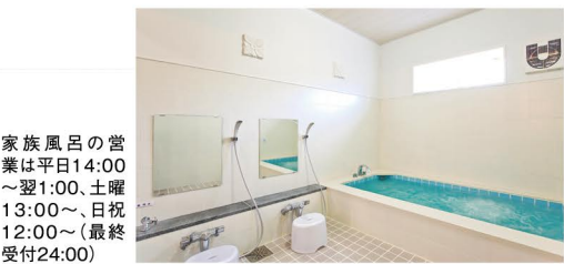
家族風呂の営業は平日14:00~翌1:00、土曜13:00~、日祝12:00~(最終受付24:00)