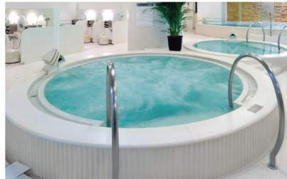
アメニティやリネン類も揃っているので、手ぶらでOK