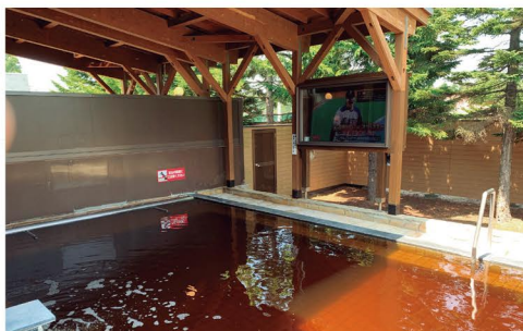
湯量豊富なモール温泉が人気の露天風呂に大型テレビを導入