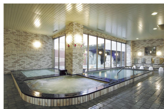
内風呂は洗い場も多く広々。ボディソープとシャンプーが備え付けになったので、タオルだけ持参すればOK!