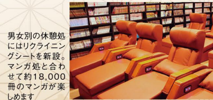
男女別の休憩処にはリクライニングシートを新設。マンガ処と合わせて約18,000冊のマンガが楽しめます