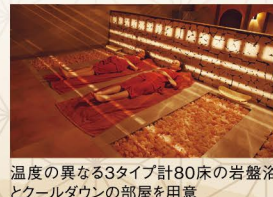
温度の異なる3タイプ計80床の岩盤浴とクールダウンの部屋を用意