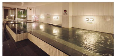
内風呂は天然ガスで加温した地下水と、天然モール泉の2つの湯が楽しめる

札幌市厚別区厚別東4-7-1-1 ☎011-897-4126 11:00~24:00(最終受付23:30) 休なし 大人450円、6~11歳140円、5歳以下70円 ※家族風呂は営業時間・料金とも異なる