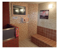
新設された低温サウナは、タイル張りなので塩サウナとしても利用可能

恵庭市恵南4-1 ☎0123-32-4171 11:00~23:00 休なし 大人440円、小学生140円、幼児無料