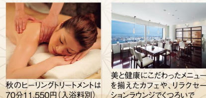
秋のヒーリングトリートメントは70分11,550円(入浴料別)