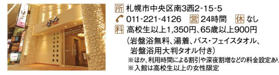
札幌市中央区南3西2-15-5 ☎011-221-4126 24時間 休なし 高校生以上1,350円、65歳以上900円 (岩盤浴無料、湯量、バス・フェイスタオル、岩盤浴用大判タオル付き) ※ほか、利用時間による割引や深夜割増などの料金設定あり ※入館は高校生以上の女性限定

地下鉄大通駅から徒歩4分の立地で、24時間営業している女性専用温浴施設。デトックス効果抜群のお風呂や岩盤浴のほか、ボディケアが受けられるリラクゼーションサロン、美容と健康にこだわったヘルシーメニューが味わえる食事処など施設充実! アメニティも揃っているの、仕事帰りにも手ぶらで気軽に利用できます。