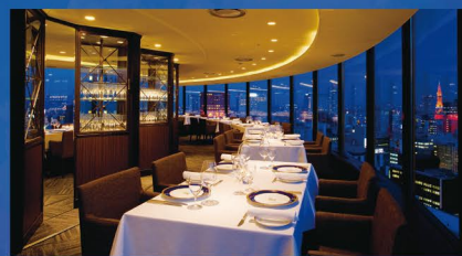
ゆっくりと回転するレストランで、パノラマ夜景を堪能

期間・時間：12/22-25は第1部17:30～、第2部20:00～、12/23-24は第1部16:00～、第2部18:30～、第3部21:00～(各2時間・20組限定) 料金：1人20,000円(税・サ込み)、2日前まで要事前予約