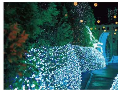
雪が積もると、一層ロマンチックな雰囲気に

多くのカップルの愛を見届けてきた宮の森フランス教会は、冬が一年で最も幻想的な雰囲気にも包まれるシーズン。南フランスから移築した200年の歴史を受け継ぐ教会の外観に、1万球のイルミネーションが輝きを添えています。今年はイルミネーションがリニューアル。新設された月のフォトスポットに注目です!