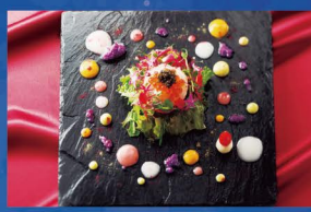
フィンランドをテーマにした特別メニューを味わって

札幌の景色を360度楽しめる回転展望レストランで、サンタの故郷・フィンランドをテーマにしたクリスマス限定ディナー「ノエル」を、12月22～25日に用意。「活エンゾアビのボワレ」「白老産黒毛和牛ロースとフォワグラのボワレ」など全8品が楽しめます。フィンランドにちなんだソースや盛り付けも魅力です。