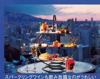
スパークリングワインも飲み放題なのうれしい