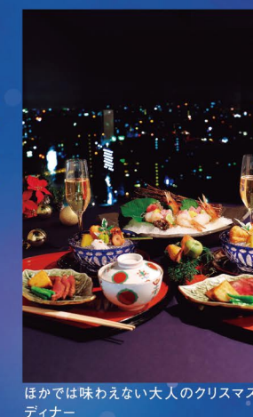
ほかでは味わえない大人のクリスマスディナー

期間・時間：12/23～25、17:30～23:00(LO21:30) 料金：1人15,000円～(税別・サ～ビス料込み)、2人から要予約