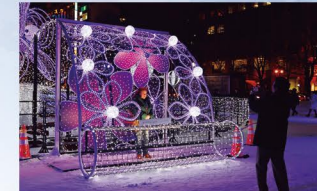
大通会場には、個性豊かなフォトスポットが多数登場

クリスマスが近づき、街が賑わいと輝きを増すこの季節。個性豊かなイルミネーション&夜景を楽しむ、とっておきのスポットに出かけませんか?