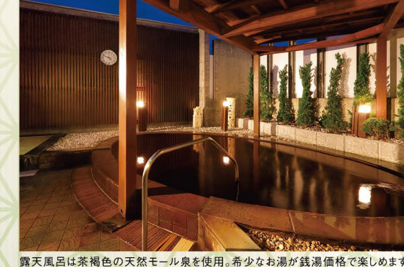
露天風呂は茶褐色の天然モール泉を使用。希少な湯が銭湯価格で楽しめます。