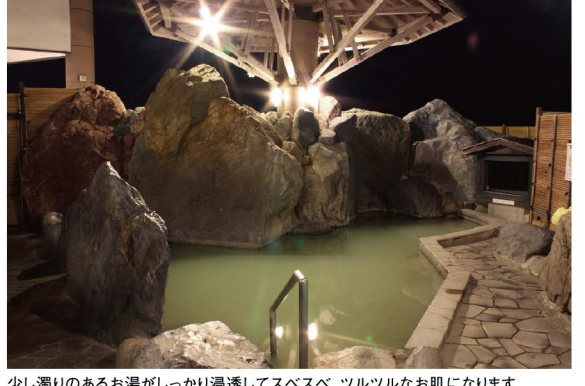
少し濁りのあるお湯がしっかり浸透してスベスベ、ツルツルなお肌になります。