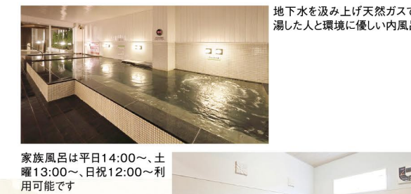
家族風呂は平日14:00~、土曜13:00~、日祝12:00~利用可能です。

天然モール泉を100%源泉掛け流しで楽しめる、市内唯一の公衆浴場。内風呂のほか露天風呂、サウナ、プライベートな空間でゆったり入浴できる家族風呂を用意しています。シャンプーやボディソープの備え付けがあるので、手ぶらで通えるのが嬉しい。10個貯めると次回入浴が無料のスタンプカードも好評。