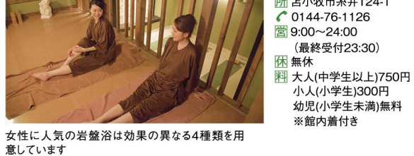
女性に人気の岩盤浴は効果の異なる4種類を用意しています。