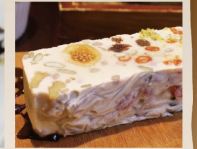
ドライフルーツのテリヌ風チーズケーキ