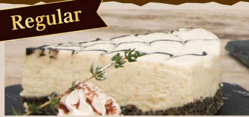
黒ゴマのレアチーズ