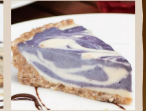
ブルーベリーマーブルタルト