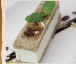
塩バニラのクッキーサンド