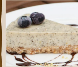
アールグレイローチーズタルト