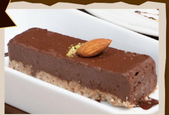
ローチョコバナナタルト

グルテンフリー、白砂糖・乳製品・動物性原料を一切使用せず作るため、アレルギーのある方でも食べられる身体に優しいケーキです。