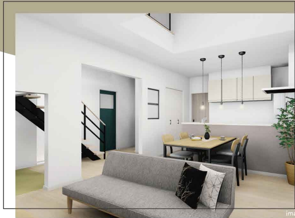
ダイニング上は2階ホールとつながる開放的な吹き抜け空間。 リビング・ダイニングに効果的に光を取り入れられます

NEW! 西岡 1-10 モデルハウス 札幌市豊平区西岡1条10丁目13番20号