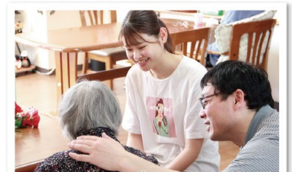
介護職員がブライトを持って入居者を手厚くサポート。こころのこもった 暖かい対応で安心。商業施設や地下鉄駅からも近くアクセスも良好。