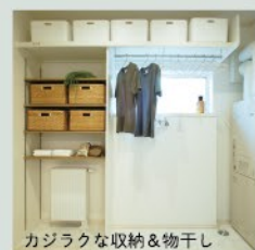
カジャクな収納&物干し