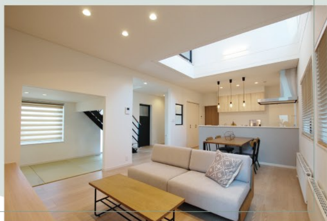
ダイニング上部は2階ホールとつながる開放的な吹き抜け空間。リビング・ダイニングに効果的に光を取り入れられます