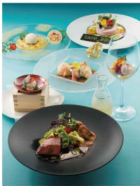
「さっぽろマリアー酒ディナー」全7品、リングを思わせる吟醸香の「千歳鶴 純米吟醸」は、グレープフルーツや香草を使った前菜のソースとマッチ