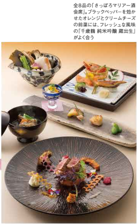
全8品の「さっぽろマリアー酒会席」ブラックペッパーを効かせたオレンジとクリームチーズの前菜には、フレッシュな風味の「千歳鶴 純米吟醸 蔵出し」がよく合う