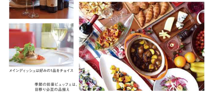
季節の前菜ビュッフェは、目移り必至の品揃え