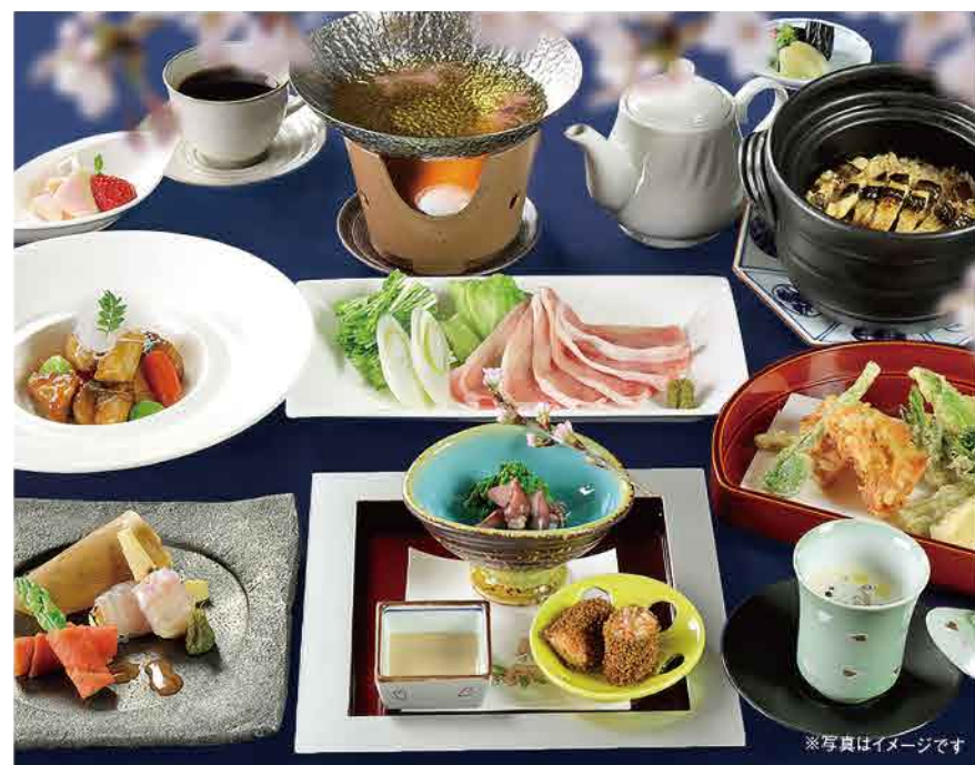
「桜餅と竹の子の生替り」「焼き穴子釜炊きご飯」など、旬の食材を楽しんで(仕入れ状況や季節によりメニューは異なります)