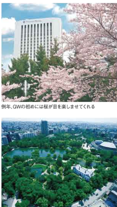
窓からの眺めは、緑豊かな中島公園がまるで庭のよう