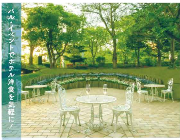
会場は緑に囲まれたテラスと、吹き抜けのあるオープンなラウンジ。ソーシャルディスタンス確保のため席を限定して開催