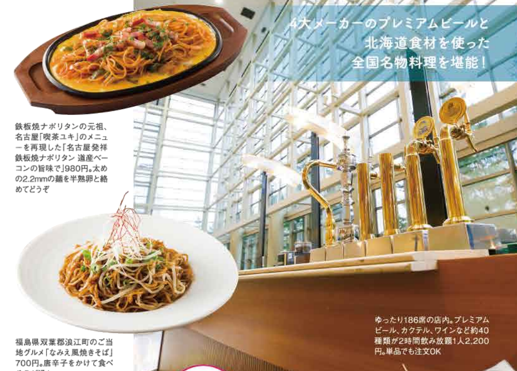
鉄板焼ナポリタンの元祖、名古屋「喫茶ユキ」のメニューを再現した「名古屋発祥鉄板焼ナポリタン 産産ベーコンの旨味で1980円。太めの2.2mmの麺を半熟卵と絡めてどうぞ

ゆったり186席の店内。プレミアムビール、カクテル、ワインなど約40種類が2時間飲み放題1人2,200円。単品でも注文OK