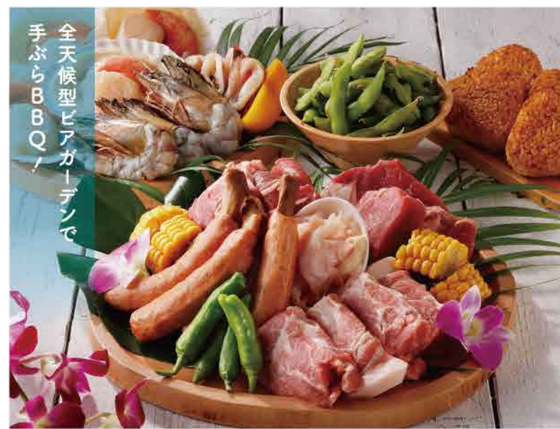
牛ロースや帆立殻付き、有頭海老、焼野菜など11品が味わえるBBQスタンダードセット1人5,500円。セットメニューは前日正午まで要予約