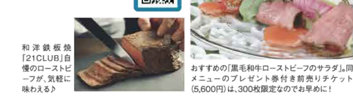
和洋鉄板焼「21CLUB」自慢のローストビーフが、気軽に味わえる!

おすすめの「黒毛和牛ローストビーフのサラダ」、同メニューのプレゼント券付き前売りチケット(5,600円)は、300枚限定なのでお早め!