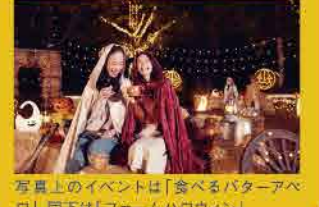
写真上のイベントは「食べるバターアベロ」。同下は「ファームハロウィン」