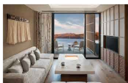
客室は全室レイクビューで開放感抜群。アイヌ民族のチセである炬燵をイメージしたテーブルを囲み、家族や仲間と団らんを楽しんで