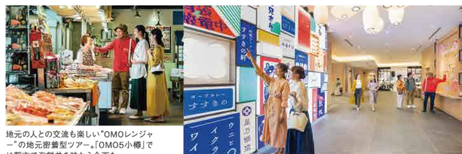
地元の人の交流も楽しい「OMOレンジャー」の地元密着型ツアー。「OMO5小樽」では朝市で海鮮丼を味わう企画も