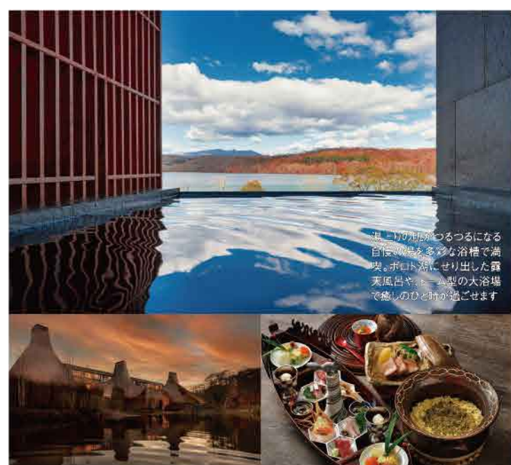
「民族共生象徴空間 ウポポイ」に隣接。ポロト湖畔にとんがり屋根の建物が立ち並び様子は、まるでアイヌの集落・コタンの様です

おすすめスポットのマップ設置や、地元ネタ満載の無料講座など、どの施設もその街を遊び尽くすアイデアが充実。特にユニークなのが、ご近所がOMOレンジャーと行くツアーです。地元のスタイルで食や観光を楽しむ、旅をより素敵なものにしていきます。