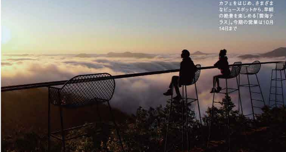
標高1,088mに位置するカフェをはじめ、さまざまなビュースポットから、早朝の絶景を楽しむ「雲海テラス」。今期の営業は10月14日まで