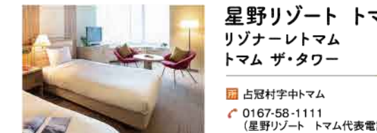
リゾートのランドマークトマム「サタデー」。カプルから子供連れの家族まで、ニーズに合わせて客室が選べ、人気です

豊富なアクティビティで大自然を満喫でき、洗練されたデザインの宿で特別な時間を過ごせる西洋型リゾートホテル「リゾナーレ」。緑深い占冠村にある「星野リゾート トマム」は、山々に囲まれた広大な敷地に、牛や羊と触れ合えるファームエリアや雲海テラス、全天候型プール、北海道グルメを楽しめる多彩な飲食店など施設が充実。思い思いの過ごし方があります。中でも魅力的なのが、季節を感じられるイペへの数々。秋は動物のマンテで衣装する「ハロウィン」や、ジェラートに見立てたデザート「サタデー」の食べ比べを開催。食事も、体験も、客室もサケづくしの「1日1組限定プラン」を堪能してください。このリゾートでの滞在は写真映えもバツリです。