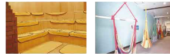
週末はロウリュ・アフグースで体も心もリフレッシュ。 娯楽スペースも充実！

札幌から車で約50分の「ホテルパラダイスヒルズ」の温泉は、「ナトリウム-塩化物冷鉱泉」という泉質で、保湿・保温効果抜群！お肌もツルツルになります。サウナでは金土日祝の17時から、男性限定でロウリュ・アフグースを開催。源泉水風呂や、休み処で販売しているサウナドリンクの定番「オロボ」を飲んでととのって。ボールプール・トランボリンなどのキッズコーナーや、卓球・カラオケ・麻雀・コミックなど、大人も子どもも一日中楽しめるアミューズメントも満載！※3月末まで火水木はお休みとさせていただきます。