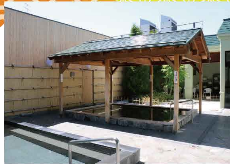
湯温が異なる2つの浴槽。ひのき風呂は木の香りや温もりを感じ心が癒されます。

☑ 花輪珈琲茶房藻岩本店 札幌市南区藻岩下2-4-11 ☎ 011-583-9349 ☑ 中学生以上2,280円、小学生以下1,140円(ワンドリンク付)