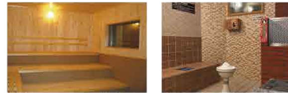
本格的フィンランドサウナ(乾式)は肌に潤いを与え、シェイプアップ効果抜群！ 低温湯サウナは美肌効果が期待でき、免疫力も高めてくれる。

恵庭岳を望む小高い丘の一角にある、豊かな樹木に囲まれた「恵庭温泉ラ・フォーレ」。北海道遺産でもあるモール温泉は有機物を多く含み、肌がツルツルする事から、「美肌の湯」と知られている。開放的な露天風呂は夜に満点の星空を堪能できる。十分に温泉を楽しんだ後は、メニュー豊富なレストランで食事をしながらゆっくりとした1日を過ごして欲しい。