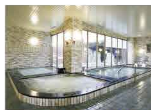
開放感たっぷりの大浴槽。洗い場にはリンスインシャンプーとボディソープを設置。