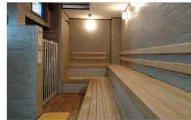
大型の乾式サウナ。じっくり汗を流しながる冷たい水風呂でととのいましょう。