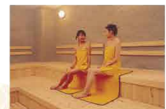
広々としたサウナでたっぷり汗を流してととのってください!