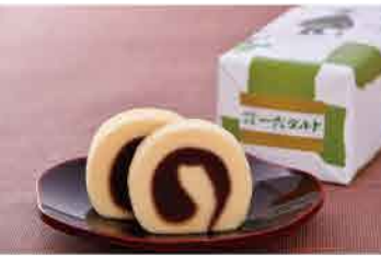
〈六本舗〉一六タルト