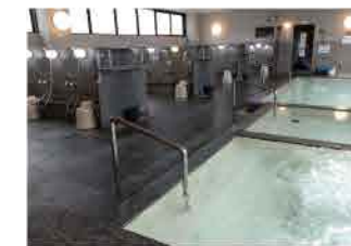
大浴槽・泡風呂・電気風呂・水風呂の4種類。お好みの風呂を楽しんで。