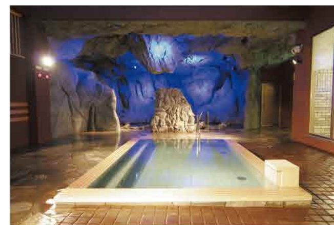
蔵ノ湯名物の洞窟風呂は、夕方になるとライトアップされて幻想的な雰囲気