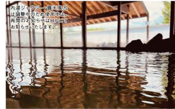
内湯・シャワー・電気風呂は調整中のため使用中止。再開の告知はHPにてお知らせいたします。

☑ 札幌市白石区南郷通14丁目北3-5 ☎ 011-846-4126 ☑ 平日14:00~24:00 土日祝 10:00~24:00 最終受付23:30まで ☑ なし ☑ 大人480円、小学生140円、乳幼児70円 ☑ 11枚綴り回数券4,800円(すべて税込) ☑ 約100台