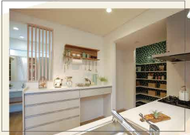
キッチンの奥にL字型のパントリー収納を設けています 食器棚上の収納棚はマグネットがつく優れもの

R POINT 事前来場予約後 モデルハウスをご見学頂いた方*に 楽天1,000ポイントプレゼント! *ご来場アンケートに全てご記入頂いた1家族につき1回限りのプレゼントとなります