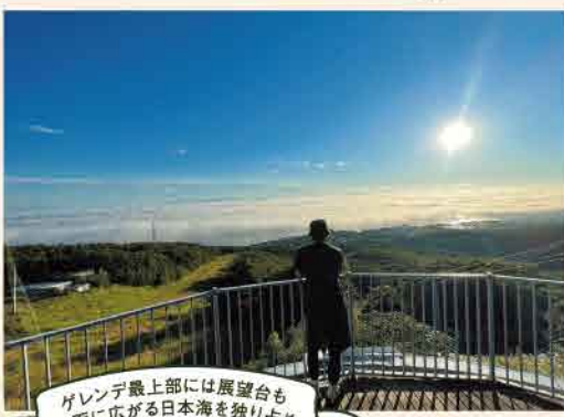
ガレンテ最上部には展望台も一面に広がる日本海を盛り占め