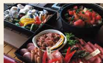
別途、BBQセットや朝食も追加可能

info グランピングで平取の自然や食材を満喫しながらゆっくり過ごしませんか 1棟料金(兼泊まり)18,000円~36,000円 / オプションでBBQ1人前6,050円(2人前から) / ホテルでの朝食1,980円追加可 【宿泊特典】ニシバの恋人トマトジュース