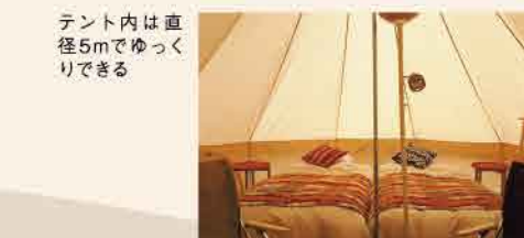
テント内は直径5mでゆっくりにできる