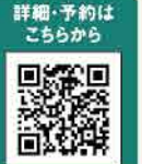
詳細・予約はこちらから

info 憧れのグランピング 新嵐山ステイ(夕朝食付) 1泊2食1名/10,800円~15,300円(子どもは食事代のみ追加) 2023年9月30日(土)まで/定員2~4名/要予約 【夕食】5種類のサイトごとに異なる食材をケータリング 【朝食】ホテルで提供