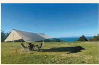
テントサイトからの眺め、天気がいい日には眼下に海が望めます