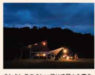
ランタンのやさしい灯りで静かな夜を