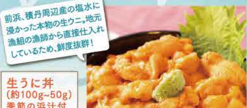
生うに并(約100g~50g) 季節の浜汁付 大4,500円/中3,600円/小2,700円 ※お値段は并の大きさにより変動します

北海道の泊村と神恵内村にまたがる、美しい積丹ブルーの海岸。絶景を眺めながらのお食事や、マリナクティビティをお楽しみください。前浜のキャンプも大人気! (トイレ・水道設備あり)