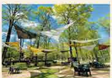
ワンちゃんと楽しめるカフェ「フォレストテラス with Dog」

info 憧れのグランピング 新嵐山ステイ(夕朝食付) 1泊2食1名/10,800円~15,300円(子どもは食事代のみ追加) 2023年9月30日(土)まで/定員2~4名/要予約 【夕食】5種類のサイトごとに異なる食材をケータリング 【朝食】ホテルで提供