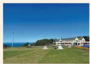
平坦な芝生で寝心地も最高、どこにテントを張ってもOK