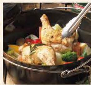
各サイトごとに異なる夕食も魅力