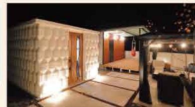
ライトアップされると精巧なデザインがより鮮明に