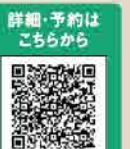
詳細・予約はこちらから

info ●宿泊期間 2023年6月1日(木)~9月30日(土) ●宿泊料金 おひとり様 11,000~20,000円 ※テラスメントは、おひとり様2,000円増し/夕食付宿泊プラン(BBQ等夕食付) 朝食別途1,500円 ●宿泊先 宿泊レジャーテント4棟(2~4名様用)、テラスメント1棟(2~6名様用) ●設備 ベッド・冷蔵庫・冷暖房・シャワー(有料)・アメニティー・ミネラル水