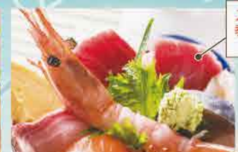
スペシャル8種盛り 季節の浜汁付 1,980円