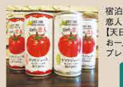
宿泊特典のニシバの恋人トマトジュース【天日塩・無添加】お一人様各1本プレゼント