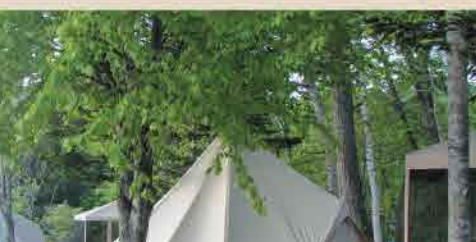
平取の大自然の中で快適に過ごそう