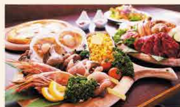
一切道具を用意せず、手ぶらで楽しめるバーベキュー

info チェックイン 12:00~16:00 / チェックアウト 翌10:00 【営業期間】6月3日~11月25日まで 【利用料金】大人1,200円・子ども500円 【別途サイト料】まきばサイト・ひつじサイト700円 / かまどサイト1,200円