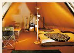
広いテントの中には、ベッドや椅子、ハンガーラックなどが置かれ、冷蔵庫も完備