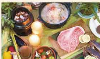
【夕食Aコース】炭火で焼く「こぶ黒牛」とタラバガニをメインに

info 夕朝食付プラン(チェックイン14:00~17:00/チェックアウト11:00) ●1名様 47,000円 ●2名様 79,000円 ●3名様 95,000円 ●4名様 107,000円 ※定員変更:大人2名+添い寝のお子さま(12歳以下)1名まで ※定員超過のお客様はエキストラテントでの宿泊