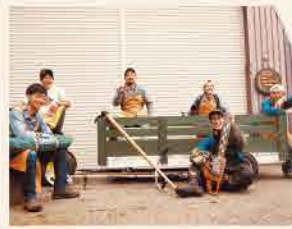
アクティビティガイドの「長ぐつクラブ」