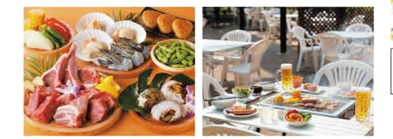
十勝牛ロース、ラムチョップ、海鮮メニューなどが味わえる「BBQプレミアムセット」1人8,000円

緑いっぱいガーデンテラスの中、冷たいビールとBBQで夏を満喫しませんか？席にはパーゴラテントが付いているので、雨の日でも安心して利用できます。フードは「ジンギスカン&BBQセット」のほか、海鮮や十勝牛が付いた豪華セットや飲み放題付きセットなど、全5種類。準備不要のお手軽BBQで、お腹も心も大満足！平日は前日12時までに要予約。土日祝日も混みあうため、事前の予約がおすすめです。