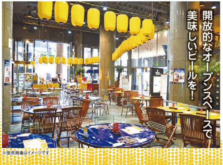
※使用画像はイメージです