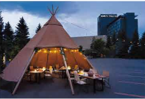
雰囲気満点の特別テント。追加料金(席料)1人700円 ※前日までの要予約

オードヴル・照り焼きプロシエト・スープ・ごはん・デザートがセットになった「特別テント限定メニュー」1人7,000円(席料込)