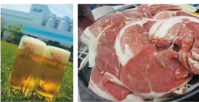
アサヒグループ直営店ならではの確かな品質のビールも楽しめます

美しい緑の芝生広がる中庭が会場となっているので、開放感たっぷり。アサヒビール北海道工場のビールタンクを眺めながら、ビールやジンギスカン、焼肉が味わえます。平日は16時まで「Happyアワー」が開催され、アサヒスーパードライ380円、ハイボール300円と通常よりお得に。フードは特選ラム肉や牛カルビなどがセットになった「はまなすガーデンセット」がおすすめ。