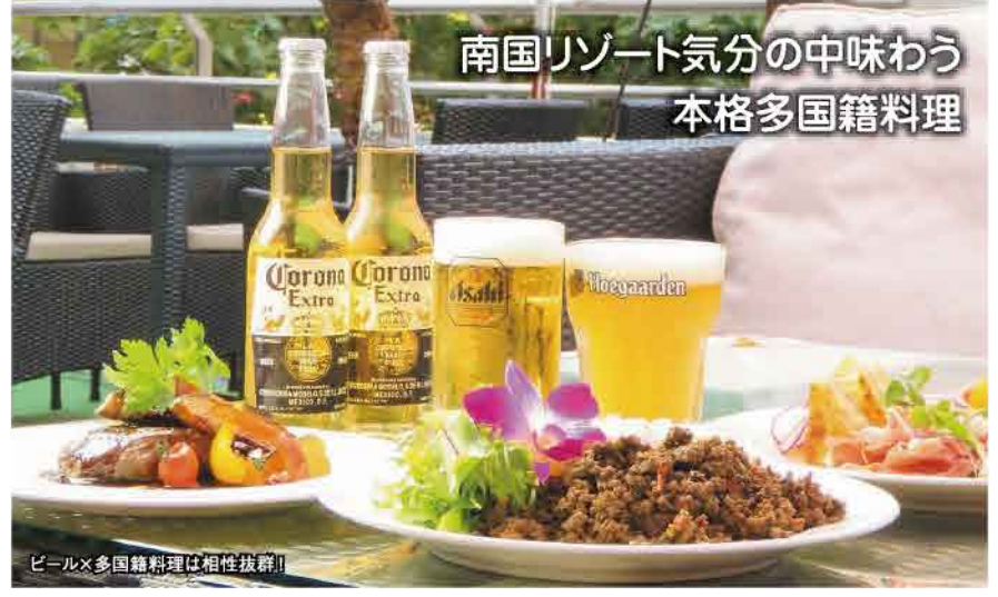
リゾート感あふれるテラス席でゆったりくつろいで

夏風が心地よいテラス席が広がり、気分はまるで南国リゾート。ビールやカクテルをはじめ、夏にぴったりなドリンクなど約60種類を用意しています。フードはピザやパスタ、ガバオライスなど、各国の料理を集めた多国籍料理が中心。魚介、野菜、肉などさまざまな旬の食材を使用したこだわりのメニューが楽しめます。9月末まで開催しており、たっぷり夏を満喫できるのうれしいポイント◎。南国気分を味わいながら優雅なひとときを。