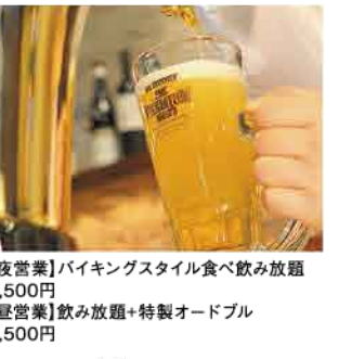
【夜営業】バイキングスタイル飲み放題 4,500円 【昼営業】飲み放題+特製オードブル 2,500円