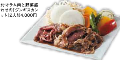
味付け肉と野菜盛合わせの「ジンギスカンセット」2人前4,000円