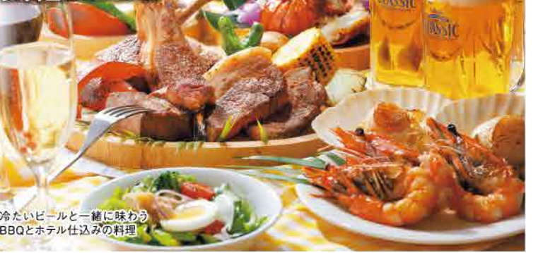
冷たいビールと一緒に味わうBBQとホテル仕込みの料理

011-530-3304 札幌市中央区南8条西5-420 札幌エクセルホテル東急 1Fレストラン「ラブル」中庭 平日 16:00~21:00 ※前日12:00迄要予約 土日祝 12:00~15:00/16:00~21:00 ※最終入店19:00