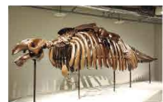
札幌周辺が海だった820万年前に、浅瀬で生息していたサッポロカイギュウの骨格標本も