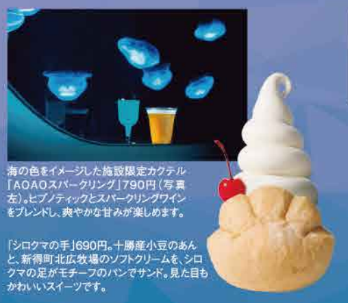
海の色をイメージした施設限定カクテル「AOAスパークリング」790円(写真右)。ヒップチェックとスパークリングワインをブレンドし、爽やかな甘みが楽しめます。

今年7月のオープンから大盛況でまだまだ休日は混みがちですが、平日は比較的空いていて、自分のペースで観覧できるそう。事前に公式HPでチケットを購入すると、入場がスムーズです。