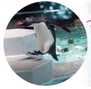
マイペースに過ごすペンギンたちを見てるだけで幸せな気分