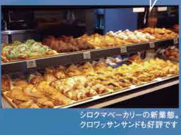
シロクマベーカーの新鮮なお惣菜。クロワッサンも好評です

6階の「シロクマベーカー&」では、バラエティ豊富なクロワッサンから、スイーツ、お酒、おつまみまでを用意。館内のどこでも味わえるので、ベンチなどに座って、好みの展示を眺めながらのんびり過ごしては。