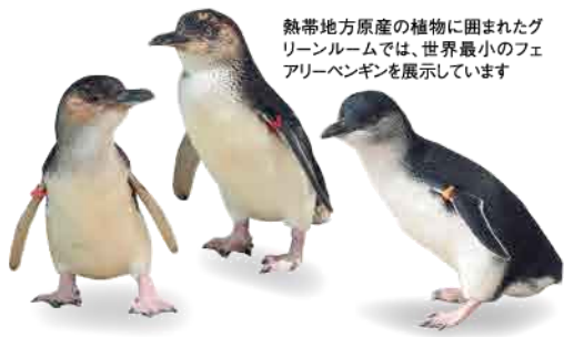
熱帯地方原産の植物に囲まれたグリーンルームでは、世界最小のフェアリーペンギンを展示しています

オープンから大盛況なのが、愛らしいキタイフビペンギンの行動展示。水に浮かんだり、陸場で飛び跳ねたり、エサを食べたりと、自由気ままに暮らす様子を360度から観察できます。展示テーマが共生空間とあって、見学者もすぐそばの「シロクマベーカー&」のクロワッサン片手に、椅子に座って眺めてもOK。ペンギンの一員になって、思い思いに過ごして。