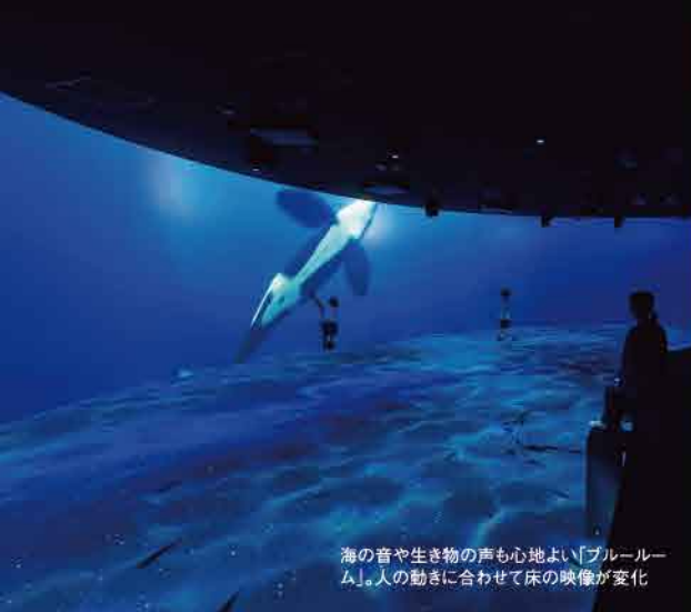
海の音や生き物の声も心地よい「ブルールーム」。人の動きに合わせて床の映像が変化