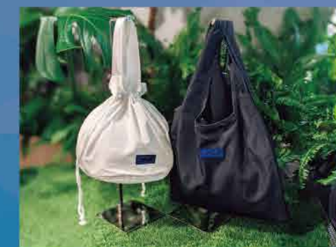
COMMONS「市販バッグ」4,500円(写真左)、「折りたたみバッグ」4,000円(同右)。スタッフのユニフォームに使用している刺繍ワッペンがオシャレ。各種白・黒2色展開