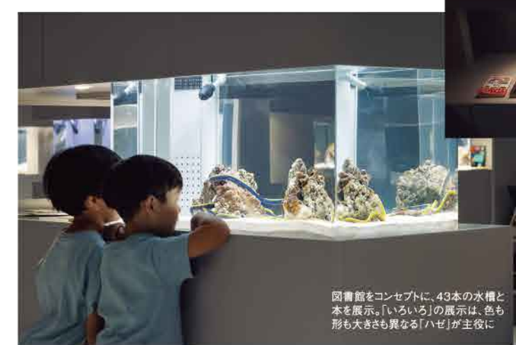
図書館をコンセプトに、43本の水槽と本を展示。「いろいろ」の展示は、色も形も大きさも異なる「ハゼ」が主役