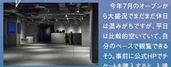
Web予約していない人は、4階エントランスでチケットを購入して

今年7月のオープンから大盛況でまだまだ休日は混みがちですが、平日は比較的空いていて、自分のペースで観覧できるそう。事前に公式HPでチケットを購入すると、入場がスムーズです。