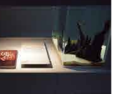
生物の特徴の説明書と関連書籍を読んで、気になる生態の知識や雑学を深めよう