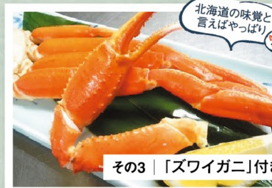
その3 | 「ズワイガニ」付き