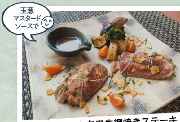
その2 | 白老牛網焼きステーキ