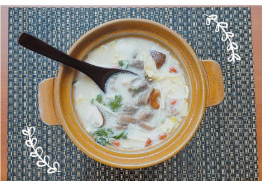
その1 | 道産エゾシカ肉入り薬膳鍋