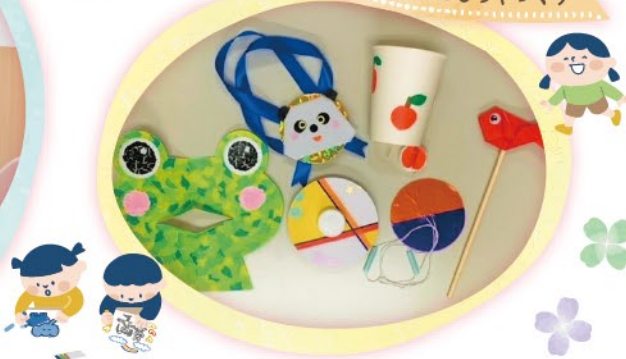
いっしょに遊ぼう! こどもが楽しめるおもちゃづくり