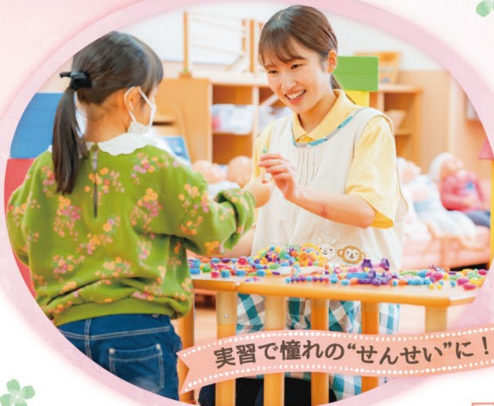
実習で憧れの“せんせい”に!