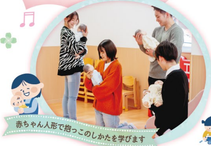
赤ちゃん人形で抱っこのかたを学びます