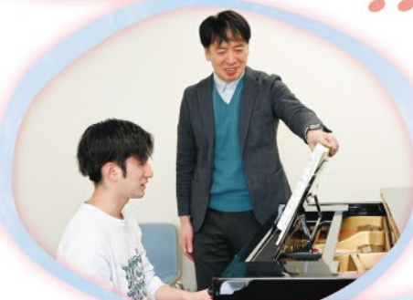
苦手?! でも大丈夫! ピアノは個人レッスン