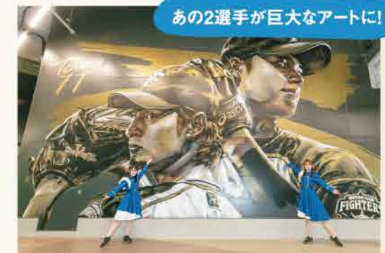
ウォールアートは縦5.5m、横7mと圧巻のスケール!