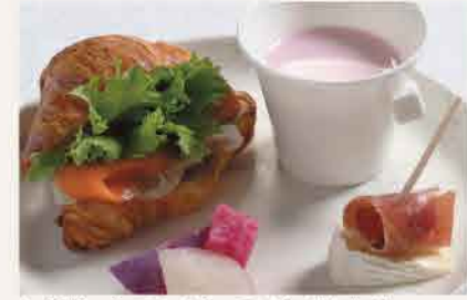
セイボリーはスモークサーモンサンドなど4品。