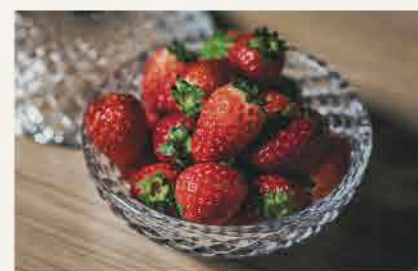
フレッシュな北海道産いちごを食べ比べて!