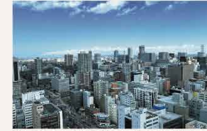
地上100mからの札幌市街の絶景を見ながら過ごして

シェフパティエ考案のオリジナリティーあふれるデザートや、Ronnefeldt(ロンネフェルト)の種類豊富な紅茶やハーブティーと一緒に楽しめる、フリードリンク付きのアフタヌーンティープラン。5月~は、札幌に初夏を知らせる木「ライラック」の紫色に彩った、美しいスイーツが集合。ピクルスやプチスープなど4品のセイボリー(軽食)付きの「天空のアフタヌーンティーセット」の他、デザート+フリードリンクの「天空のアフタヌーンデザートセット」(3,900円)も。