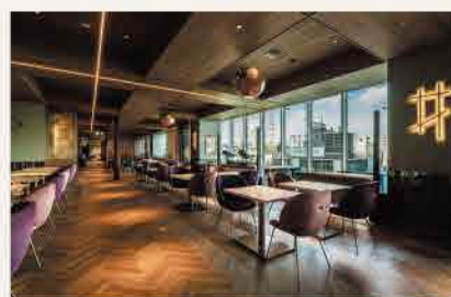
開放感ある空間は札幌の街並みが一望できる