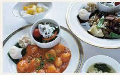
中華セットのメイン料理は海老のチリソースor 豚肉のキャベツのみそ炒め

車で朝里ICから5分、自然豊かな朝里川温泉のリゾートホテル。森林浴気分を味わえる露天風呂で温泉を楽しみつつ、美味しいお食事も満喫できるのが人気の理由。おすすめは、食事と温泉がセットになった「ゆららお食事セット」。洋食・中華・和食のセットメニューと温泉入浴がセットになったお得なプランです。季節の移ろいが楽しめる解放感のある天然温泉と、主に道内産の食材を使用したバランスのとれた食事メニューで、ゆっくりと楽しんで。