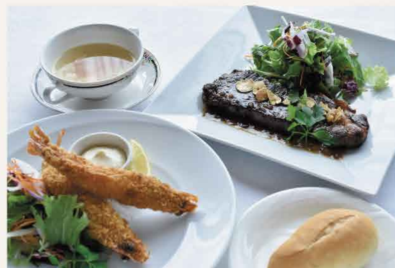
洋食セットは、大海老のフライもしくはサーロインステーキからメイン料理をセレクト