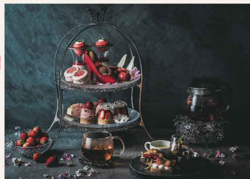
紅茶は1名2ポットまでたっぷり楽しめる