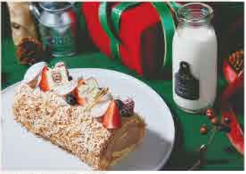
cafe&bar「つきの」のクリスマスケーキは4,000円。15～20時に1日20個限定販売