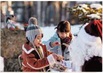
期間中は毎夜、サンタさんからトマム牛乳を使ったミルクキャンディをプレゼント♪