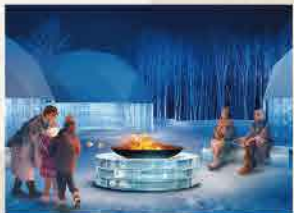
暖をとれる「氷の広場」が初登場。焼きマッシュロも楽しめます

期 12月10日～2025年3月14日(予定) 時 17:00～22:00(最終入場21:30) 料 入場料600円(小学生以上) ※トマム サ・タワー/リゾナーレトマム宿泊客は無料(会員プランは除く)