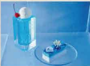
「氷のバーラー」ではフロゼンケーキや氷のクリームソーダを提供