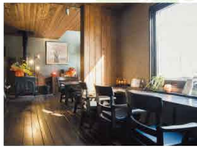
札幌市南区 柏丘店