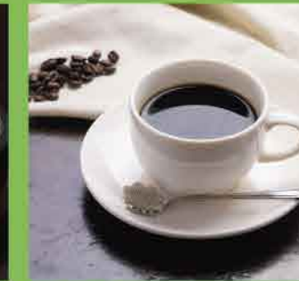
ブレンドコーヒー