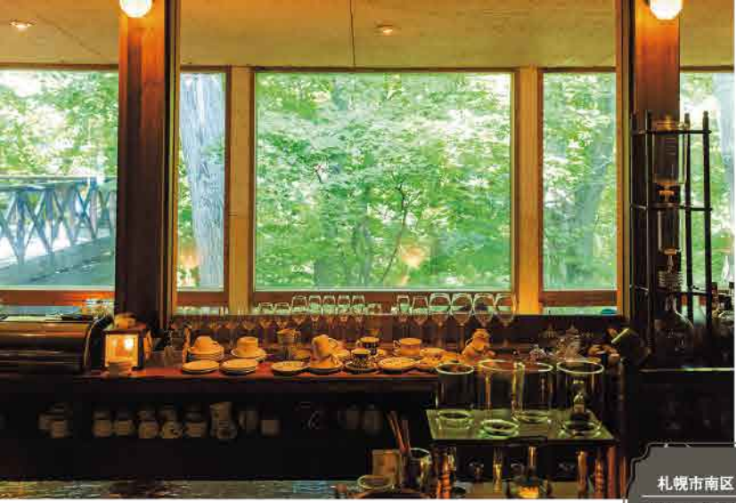
札幌市南区 藻岩本店