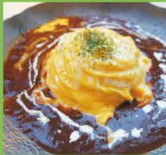
ドレスオムライス

こだわりの珈琲をはじめ、とっておきのスイーツやお食事でお迎えます。贅沢に過ごす、くつろぎタイムをお楽しみください。