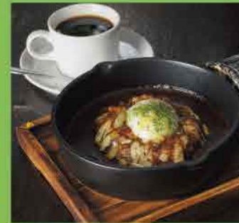
スキレットのチーズカレー