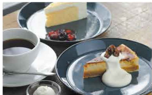
札幌市中央区 東屯田 通店